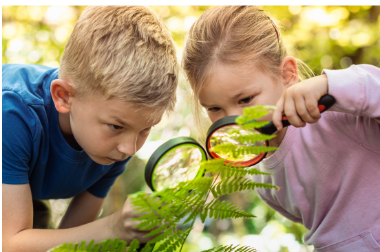
Das Team von Observatorium

Diese Anregung floss direkt in die Gespräche ein und stieß auf Begeisterung. Knifflig ist jetzt, das im Gesamten zu denken. Das Gründach benötigt eine solide Bewässerung und die Statik muss angepasst werden. Die Mühen wird das Ergebnis wert sein. Denn schon wieder wurde das naturpädagogische Angebot des künftigen Grünen Klassenzimmers und Naturerlebnisraums um das Thema Wassergewinnung anschaulich erweitert.